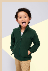
NORTH KIDS 00589