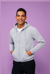
SEVEN MEN 47800