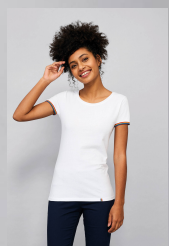
RAINBOW WOMEN 03109