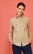
BURMA WOMEN 02764