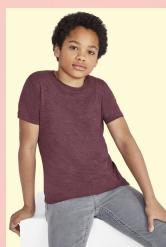
REGENT FIT KIDS 01183