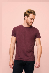
REGENT FIT 00553