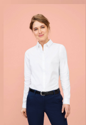
BRODY WOMEN 02103