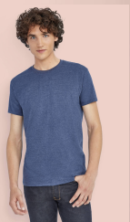
IMPERIAL FIT 00580