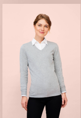
GLORY WOMEN 01711