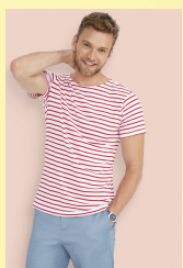
MILES MEN 01398