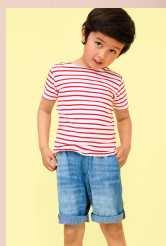
MILES KIDS 01400