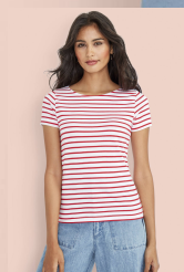
MILES WOMEN 01399