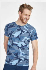
CAMO MEN 01188