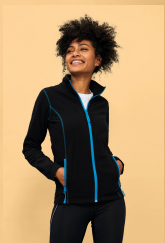
NOVA WOMEN 00587