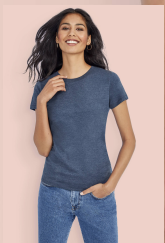
IMPERIAL FIT WOMEN 02080