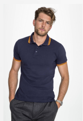
PASADENA MEN 00577