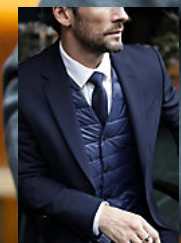
NEOBLU MARIUS MEN 03164