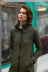
NEOBLU ANTOINE WOMEN 03175