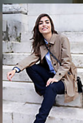
NEOBLU ALFRED WOMEN 03177