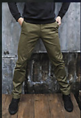
NEOBLU GUSTAVE MEN 03178